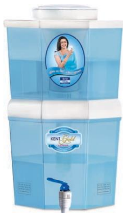
Coswatech Tara Gold optima KENT GOLD OPTIMA Purificateur par gravité