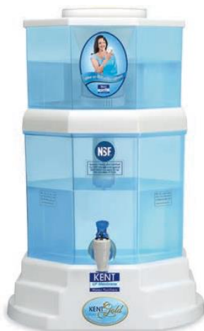
Coswatech Tara Gold KENT GOLD Purificateur par gravité