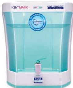
Coswatech SITA Maxx KENT MAXX Double Purification UV+UF