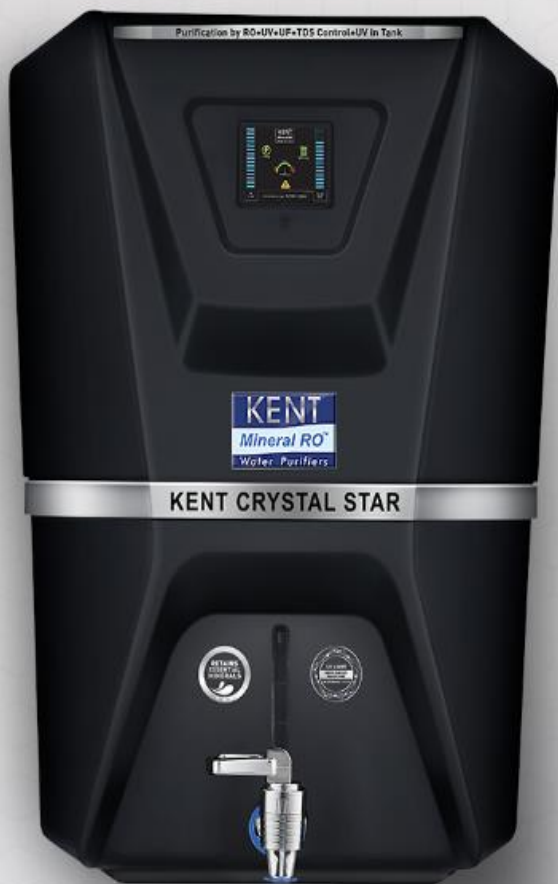
KENT Crystal Star-B RO Water Purifier