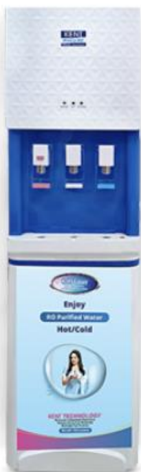
Coswatech Rama Galaxy KENT GALAXY Chiller-Cum-Water Dispenser