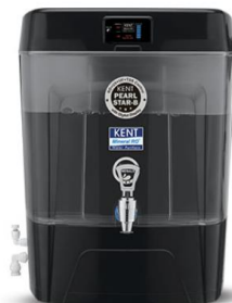
Coswatech SITA Maxx Alcaline B KENT MAXX ALKALINE B Double Purification UV+UF+alcaline