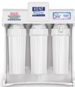
Coswatech RAMA ELITE + new KENT ELITE + new Commercial RO Water Purifier