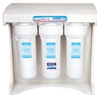
Coswatech RAMA ELITE + KENT ELITE + Commercial RO Water Purifier