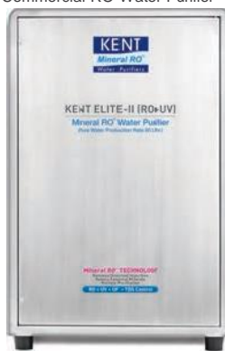
Coswatech RAMA ELITE-II KENT ELITE-II Commercial RO Water Purifier