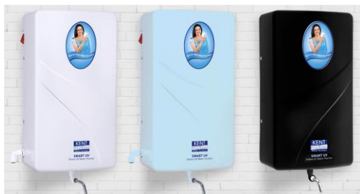
Coswatech SITA SMART KENT SMART Double Purification UV