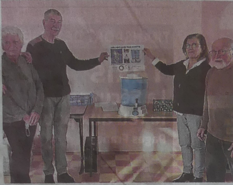
L'association ARC'avène a été l'une des premières à contribuer. P. B.