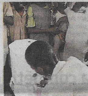
Des fontaines réutilisables.

goin. Et la solidarité, quand elle est partagée entre tous, ça ne prend rien du tout : il y a par exemple 100 autres départe-