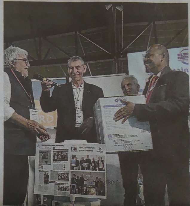
Le maire de Mtsamboro (à d.), a reçu les fontaines à eau pour l'île. A. B.

matique cruciale sur l'île. « On traite toujours les urgences. Il y a parfois de l'eau qui coule du robinet, mais pas toujours. Mais le problème, c'est qu'elle n'est pas du tout potable. Même l'Agence régionale de santé n'arrête pas de le dire. » Comme sur le reste de l'île, sa commune, peuplée de 10 000 habitants, fait aussi face à l'absence de reconstruction des habitats. « La reconstruction, poursuit-il, on en parle tout le temps. Mais dans les faits, rien n'a commencé. Ça va trop lentement ! Certaines entreprises, mobilisées pour les premiers déblaiements, n'ont toujours pas été payées. » Côté énergie, « les maisons ont de l'électricité, mais l'éclairage public est défaillant, cela pose des problèmes graves d'insécurité ». L'élu mahorais reconnaît cependant « les efforts » entrepris par l'État. Mais « ça va trop lentement ; l'impatience gagne du terrain. Mayotte a une population très résiliente, mais jusqu'à quand ? Ils se sentaient abandonnés avant Chido, mais aujourd'hui, ce sentiment d'abandon est encore plus présent. »